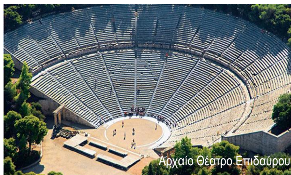
Αρχαίο Θέατρο Επίδαυρου